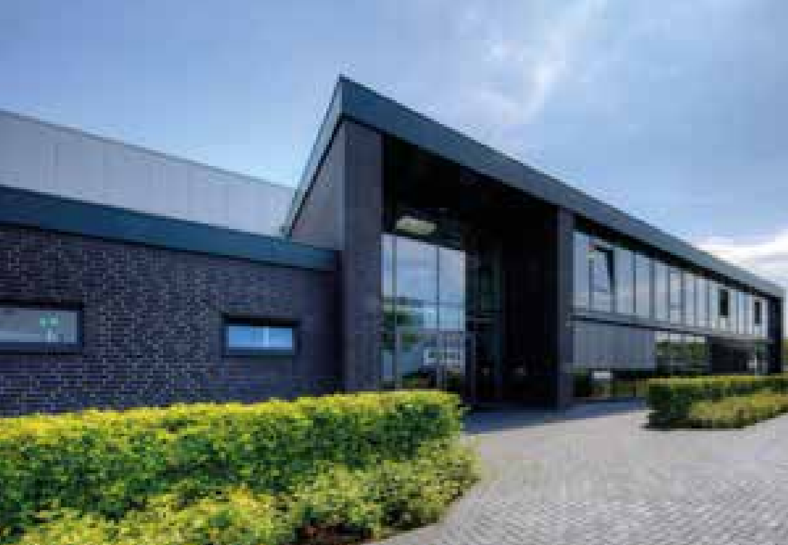
PRODUKTIONSHALLE MIT BÜRO UND SOZIALTRAKT Schlüsselfertige Erstellung, Leopoldshöhe

„Auch bei der vierten Ausbaustufe unseres Fertigungszentrums durch Hochbau Detert ziehen wir unser Fazit: Gut gebaut! Absprachen eingehalten, Termine geschafft, Qualität hergestellt und dabei stets sichergestellt, dass wir über alle Schritte im Bilde waren.“