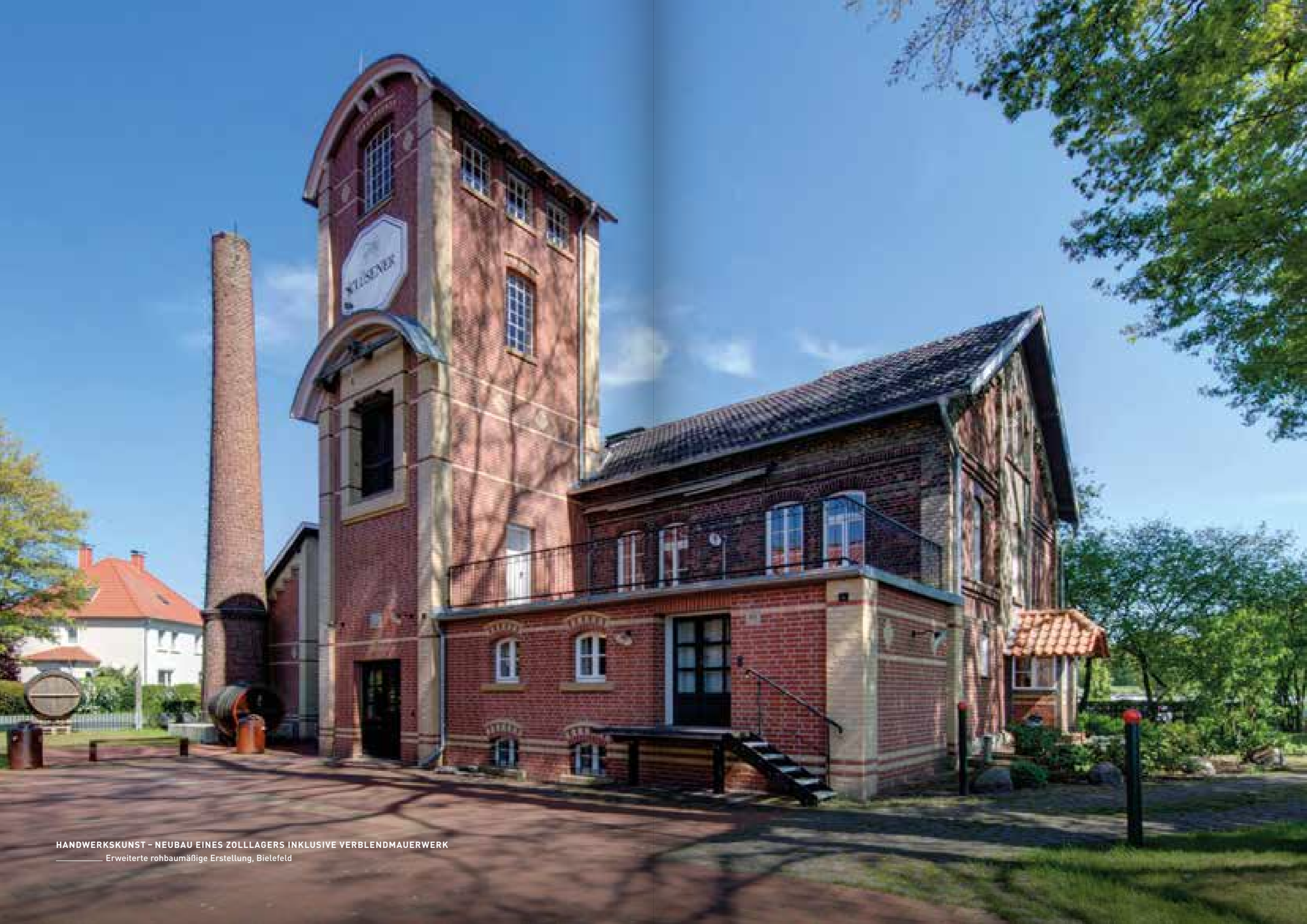
HANDWERKSKUNST - NEUBAU EINES ZOLLAGERS INKLUSIVE VERBLENDMAUERWERK Erweiterte rohbaumäßige Erstellung, Bielefeld