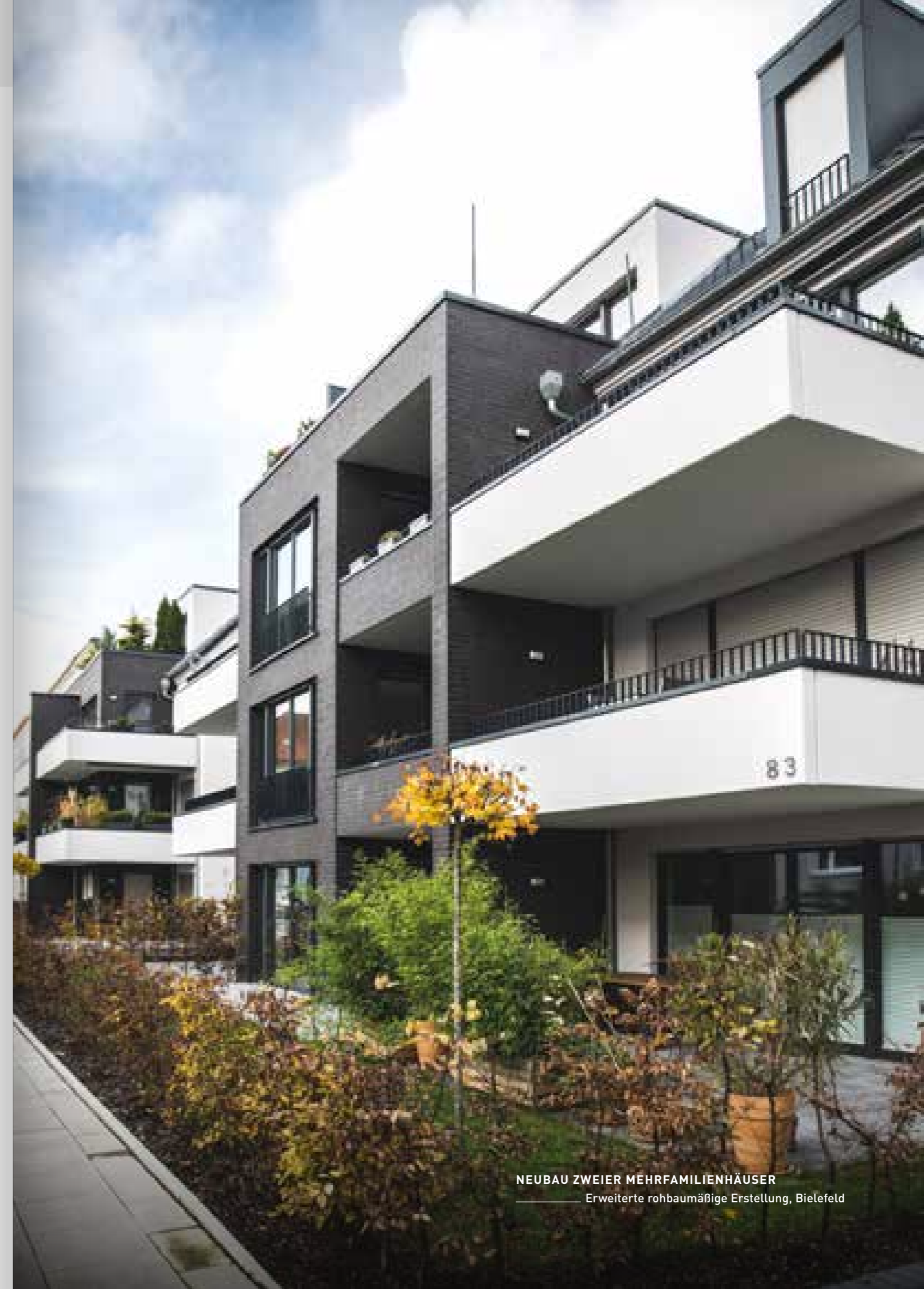
NEUBAU ZWEIER MEHRFAMILIENHÄUSER Erweiterte rohbaumäßige Erstellung, Bielefeld